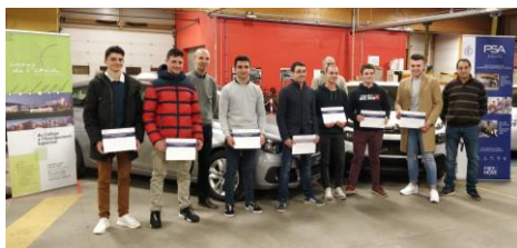
Remise des Labels PEUGEOT & CITROEN Lauréats promotions 2017 et 2018

Ce dispositif, dépendant de l'accord-cadre entre l' Education Nationale et le groupe PSA PEUGEOT-CITROEN-DS , se veut être un tremplin pour l'insertion professionnelle. Ainsi, un groupe d'une douzaine de jeunes de 1 ère et Terminale Bac Professionnel Maintenance des Véhicules option Voitures Particulières se voient offrir un complément de formation au sein de l'établissement : 17 heures de formation de communication dispensées par des formateurs du groupe PSA, ainsi que 40 heures de formation technique spécifique sur les véhicules des deux marques animées par des enseignants du lycée spécialement formés. A cela s'ajoutent 8 semaines de formation en entreprise dans des concessions ou des garages PEUGEOT ou CITROEN effectuées sur temps de vacances scolaires et qui viennent s'ajouter aux 22 semaines réglementaires du Bac Pro.