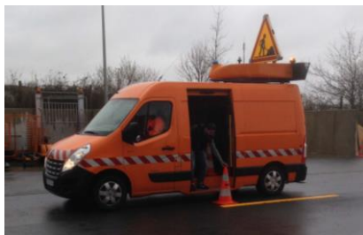
Exercice de pose de balises